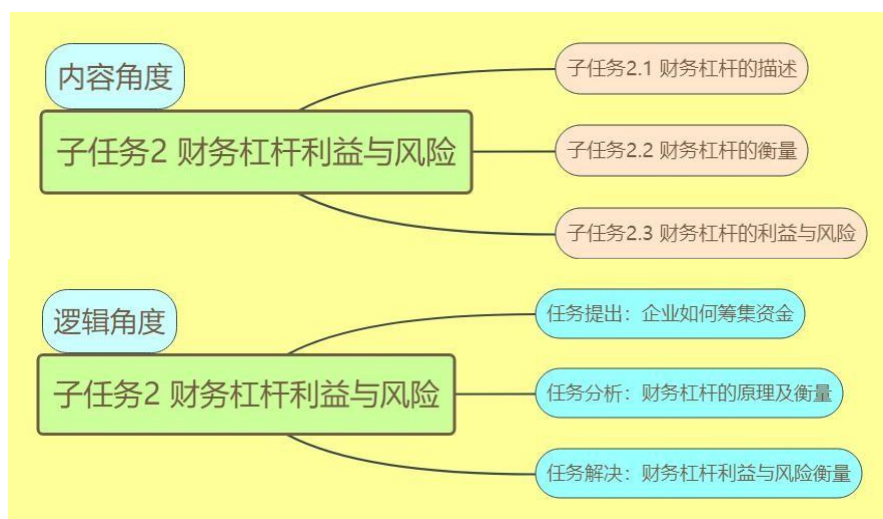
图 2 任务驱动法下任务明细

(1) 任务驱动法 ：将《财务管理学》内容划分为项目模块，每个项目分别按照授课内容和逻辑进行教学任务的划分，在云班课 APP 上发布任务给学生。