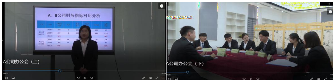
图4图5：A 公司财务经理介绍公司经营情况 A 公司办公会决策现场

2020 年初新冠疫情爆发使企业面临现金流趋紧、供应链中断、市场供求普遍下滑等压力，多数企业预计 2020 上半年营收将明显下降。企业应该采取灵活的筹资方式筹集资金，压缩开支努力应对疫情影响，保障复工复产顺利运转。A 公司在复工后召开紧急董事会议，讨论企业的筹资方式，由公司财务部经理提供的财务报表可知，和 A 公司情况类似的 B 公司，每股收益增长率远远高于 A 公司，究其原因主要在于 B 公司有债务资金，债务利息发挥了财务杠杆的正效应，放大了企业的收益，基于此原因，财务经理提请董事会建议采用债务筹资的方式举借债务，一方面可以增加资金来源渠道，为 A 公司复工复产提供资金保障，另一方面可以发挥债务利息的财务杠杆效应。A 公司董事会经讨论后认为，在疫情影响下，目前公司生产经营状况波动较大，企业利润相较同期下降了 60%，所以经营风险较大，这种情况下不适合举借债务资金筹资，因为债务利息成本较高且固定，财务杠杆较高，容易带来较大财务风险。因此企业决定采用权益资金筹资方式募集资金，保证复工复产顺利进行。